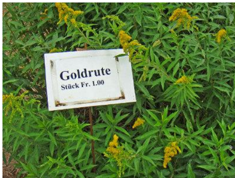
1: Verboten aber im Handel

Zürich, 14.06.2017. Die ETH-Zürich Spin-off IN-FINITUDE packt das Neophyten-Problem bei der Wurzel. Mit der selbst entwickelten, interaktiven webbasierten Geoplattform «Pollenn»® vernetzt sie Gemeinden und private Grundstückbesitzer und unterstützt sie in der Bekämpfung von invasiven Neophyten.